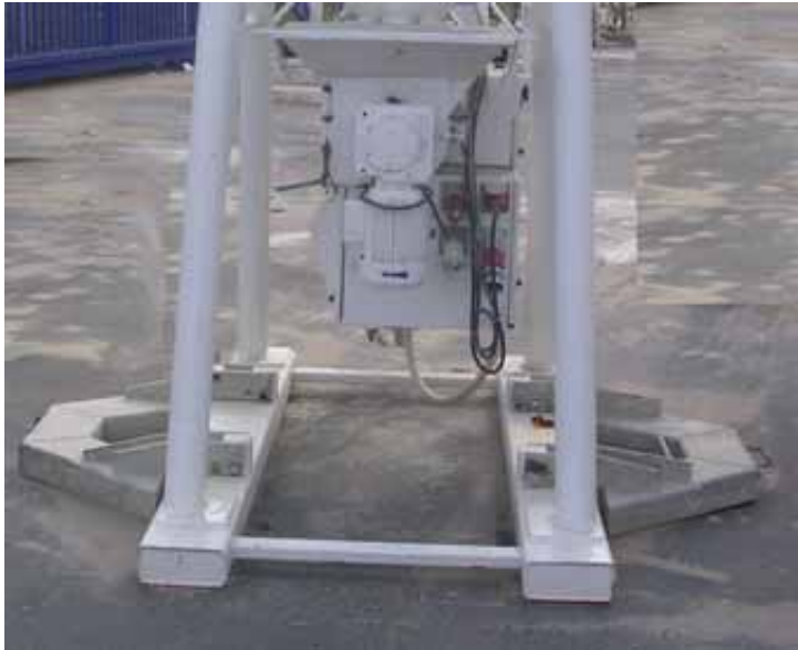
Bild 4: Verbreiterung der Aufstandsflächen zur Erhöhung der Standsicherheit