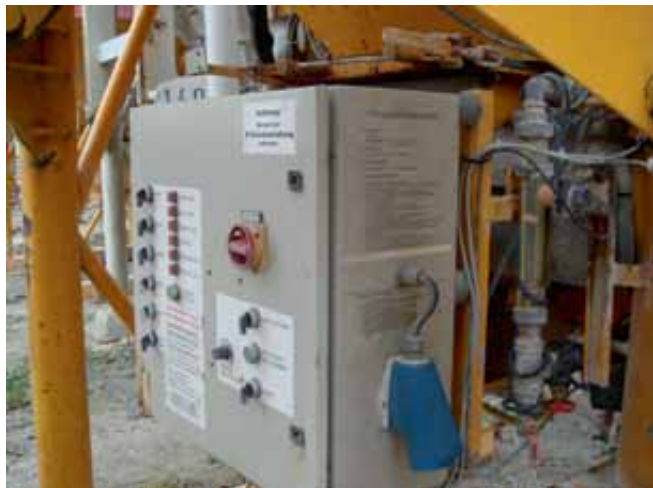
Bild 5: Steuereinheit mit Hauptschalter und Hinweisen zum sicheren Betrieb.

Daher sollen nur die in der Betriebsanweisung angegebenen Tätigkeiten durchgeführt und Arbeitsabläufe eingehalten werden. Grundlage der Betriebsanweisung ist die jeweilige Betriebsanleitung des Herstellers (siehe Bild 5).