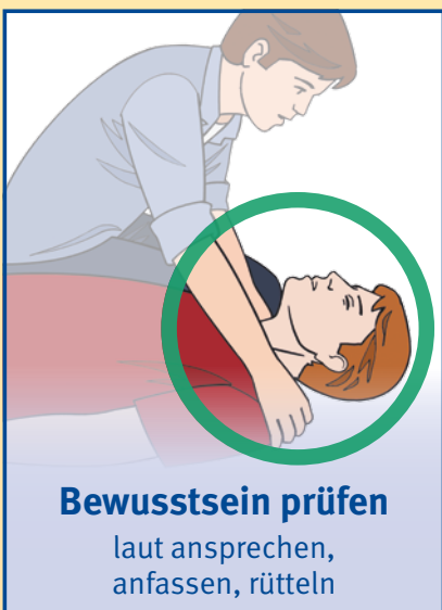
Bewusstsein prüfen laut ansprechen, anfassen, rütteln