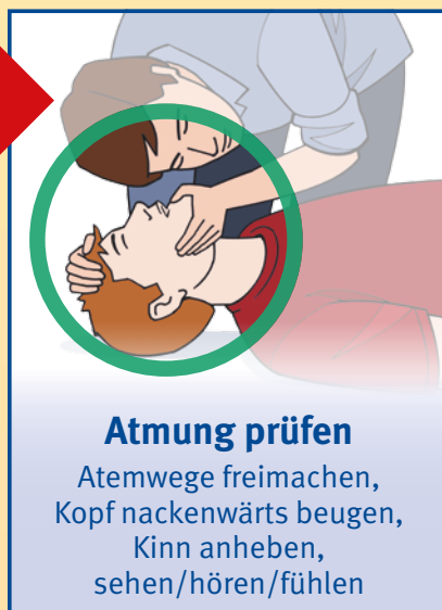
Atmung prüfen Atemwege freimachen, Kopf nackenwärts beugen, Kinn anheben, sehen/hören/fühlen