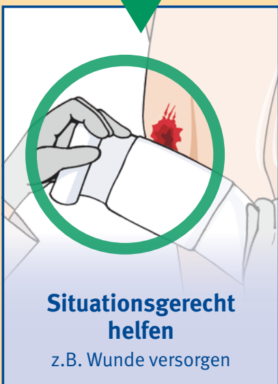
Situationsgerecht helfen z.B. Wunde versorgen