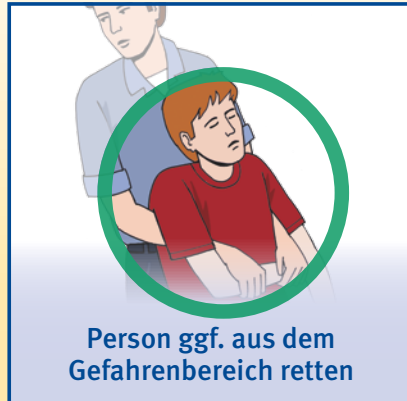
Person ggf. aus dem Gefahrenbereich retten