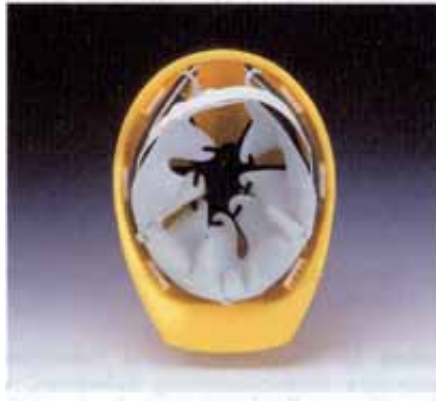
Bild 9: Industrieschutzhelm für Kopfverletzte mit Zacksleder-Innenausstattung