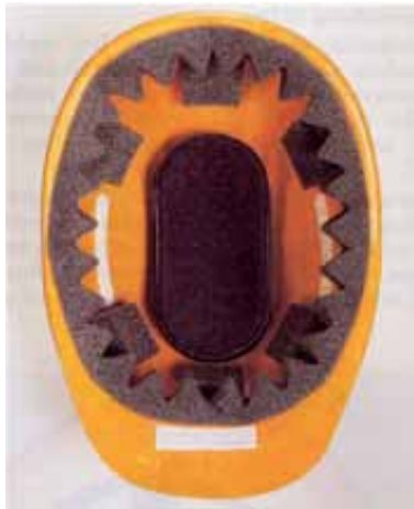
Bild 8: Industrieschutzhelm für Kopfverletzte mit Schaumstoff-Innenausstattung