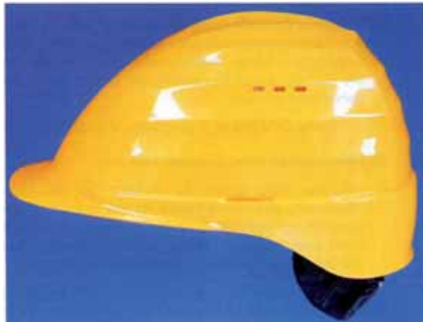
Bild 2: Industrieschutzhelm mit heruntergezogenem Nackenteil, Belüftungsöffnungen und seitlichen Schlitzern zur Befestigung von Zubehör (z.B. Gehörschützer), jedoch ohne Regenrinne