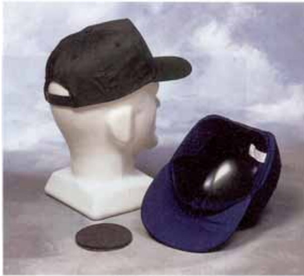
Bild 6: Industrie-Anstoßkappe mit textiler Umhüllung als Schirmmütze