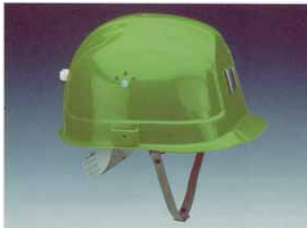
Bild 3: Industrieschutzhelm mit verkürztem Schirm, Lampen- und Kabelhalter, Kinnriemen (Zubehör)