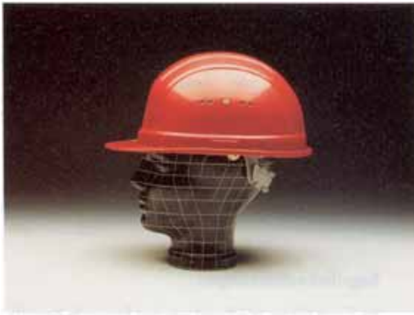
Bild 1: Industrieschutzhelm mit Regenrinne, Belüftungsöffnungen und seitlichen Stecktaschen zur Befestigung von Zubehör (z.B. Gehörschützer)