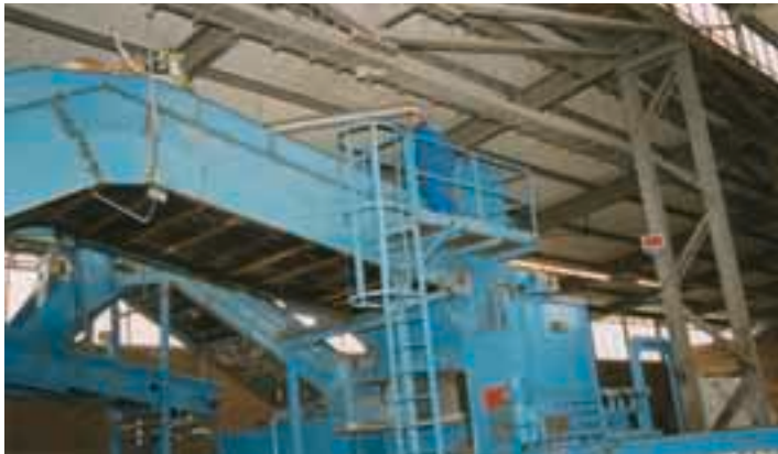
Bild 7: Sicheres Arbeiten am Pressenschacht von der Arbeitsbühne aus

An Maschinenteilen, bei denen die Instandhaltungsarbeiten nicht vom Boden, nicht von mobilen Arbeitsmitteln oder von geeigneten Standflächen aus durchgeführt werden können, sind Wartungsbühnen mit entsprechenden Zugangsmöglichkeiten (Steigleiter, Treppe) vorhanden.