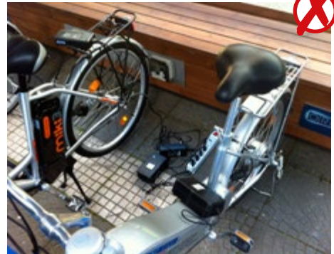
Abb. 18 Nicht empfehlenswert; Ladegeräte liegen auf dem Boden und sind über eine Mehrfachsteckdose unterverteilt (marktübliche Ladegeräte sind nur für die Benutzung in „trocknen Räumen“ geeignet)