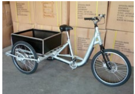
Abb. 1 Einsatz – und Nutzungsmöglichkeiten des Pedelecs 25