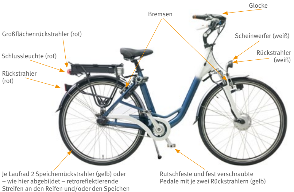
Abb. 7 Vorgeschriebene Ausrüstung des Pedelec 25

Pedelecs 25 müssen mit einem Scheinwerfer und mit einer Schlussleuchte ausgestattet sein. Sie können mit Strom aus einer