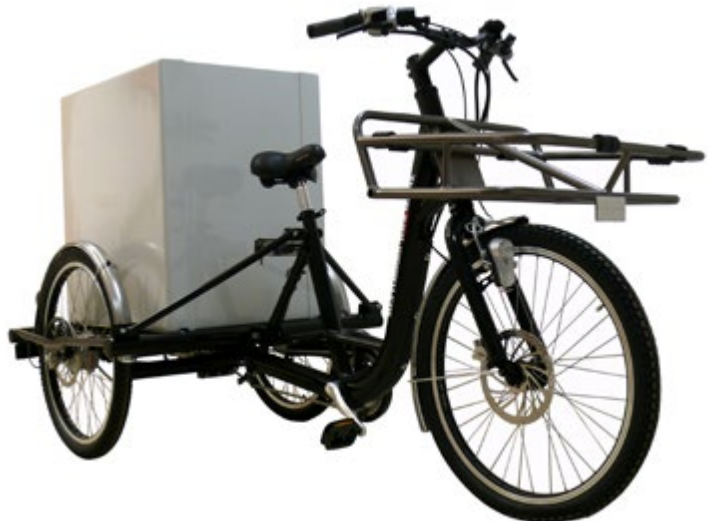
Abb. 3 Mehrspuriges Pedelec 25