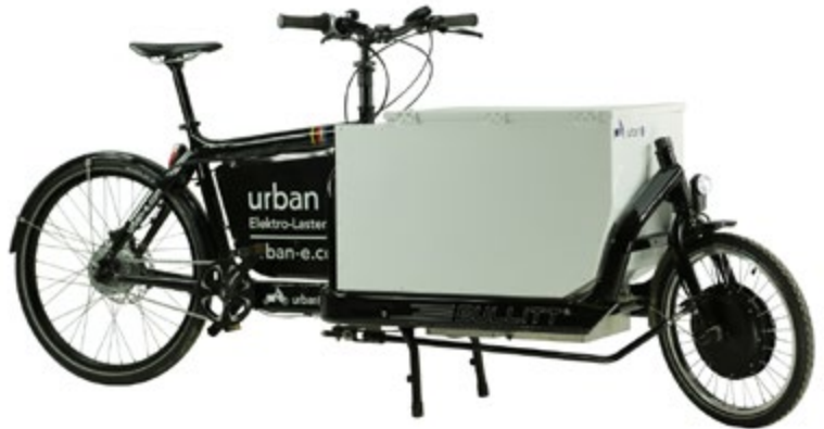
Abb. 2 Einspuriges Pedelec 25