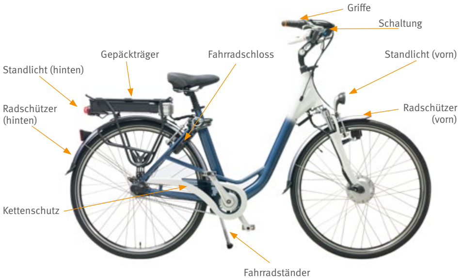
Abb. 9 Empfehlenswerte Zusatzausstattung des Pedelec 25