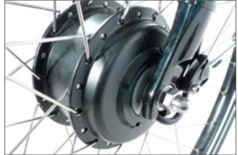
Abb. 4 Nabenmotor im Vorderrad

Der Motor befindet sich in der Nabe des Vorderrades. Die Kombination mit jeder Schaltung und Rücktrittbremse ist möglich. Nachteilig kann mangelnde Traktion (Griffigkeit) speziell beim Anfahren am Berg und in Kurven, auf rutschigem Untergrund sowie bei heckseitigem Schwerpunkt sein.