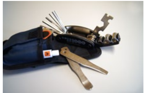
Abb. 11 Schrauben- und Inbusschlüsselset