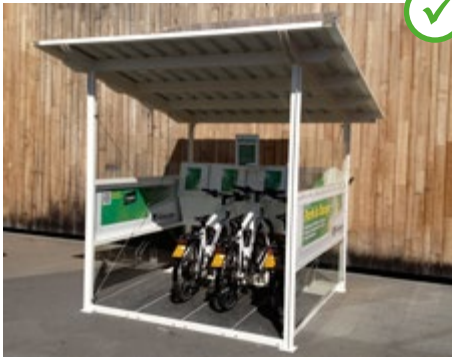
Abb. 17 Öffentliche Ladestation an einem Einkaufszentrum