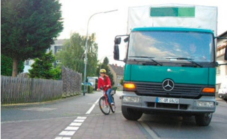
Abb. 16 Gefahr durch „Toten Winkel“