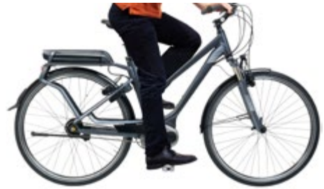
Abb. 14 Richtig eingestellte Sitzhöhe beim Tretvorgang

Die Einstellung der richtigen Sitzhöhe resultiert aus der Verstellung der jeweiligen Sattelhöhe. Die Sattelhöhe ist richtig eingestellt, wenn Sie – auf dem Sattel sitzend – mit den Fußballen beider Füße den Boden soeben erreichen können. Beim Tretvorgang selbst sollte das Bein im Kniegelenk nahezu vollständig gestreckt werden können. Die Sattelstütze darf maximal bis zu der jeweiligen umlaufenden Markierung herausgezogen werden. Hierbei ist die Mindesteinstecktiefe der Sattelstütze konsequent einzuhalten.