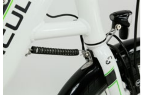
Abb. 10 Lenkungsdämpfer

Wird ein Pedelec 25 auf einem Zweibeinständer abgestellt, hat in der Regel das Vorderrad keinen Kontakt zum Boden und schwebt frei. Ein Lenkungsdämpfer stabilisiert die Vordergabel in Fahrtrichtung beim Abstellen und verhindert damit ein unkontrolliertes Verdrehen des Lenkers. Somit wird das Beschädigen von z. B. elektrischen Leitungen und Bowdenzügen vermieden.