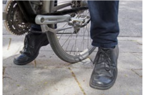
Abb. 13 Richtig eingestellte Sitzhöhe im Stand

Um eine angenehme, sichere und kraft-effiziente Sitzposition auf dem Pedelec 25 einnehmen zu können, ist die größtmögliche Anpassung des Pedelecs 25 an die jeweiligen individuellen Körpermaße des Benutzers erforderlich. Die benutzerabhängig erforderlichen Grundeinstellungen sollten vor Fahrtbeginn geprüft und gegebenenfalls angepasst werden. Dies wird durch die richtige Einstellung von Sattel und Lenker erreicht.