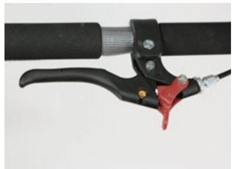
Abb. 12 Feststellbremse