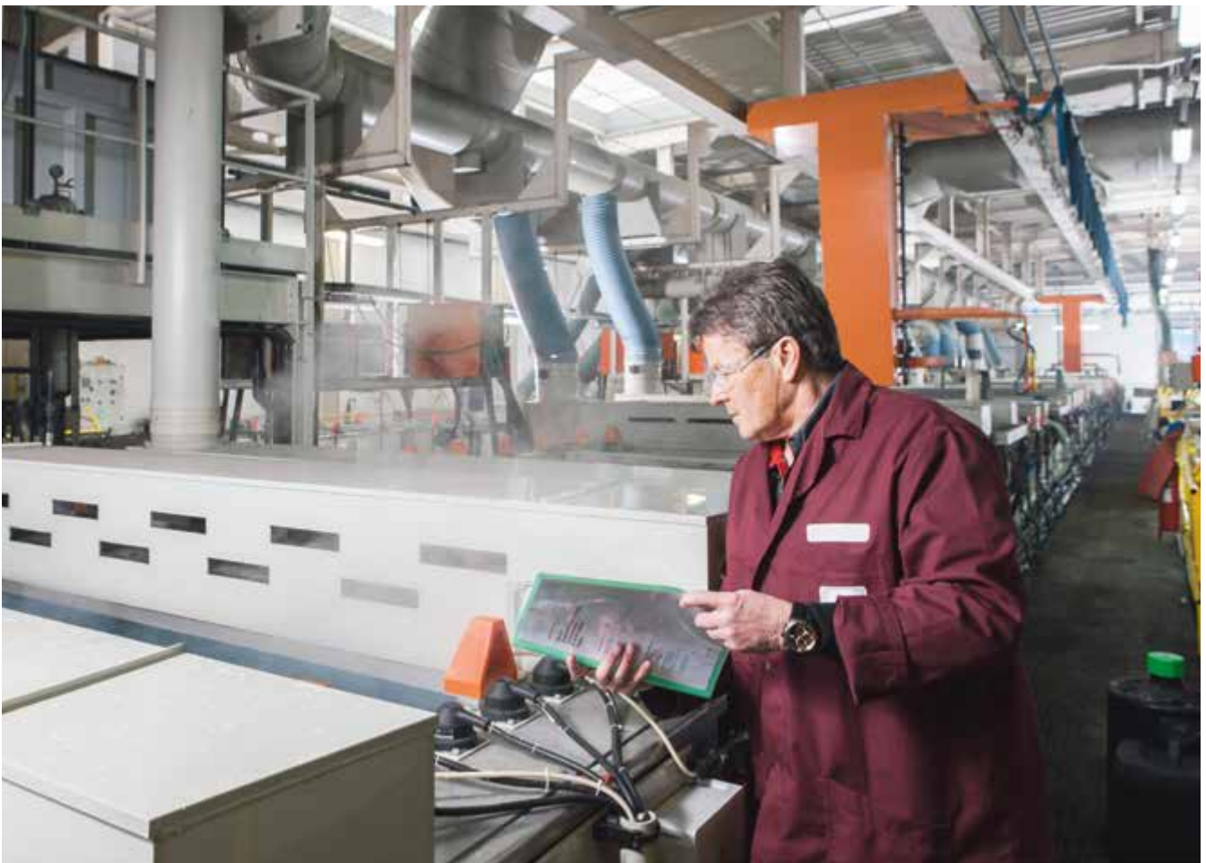
Abb. 23 Prüfung der Galvanikanlage durch eine befähigte Person

Zum sicheren Betrieb der Anlage und ihrer Komponenten sind erstmalige und wiederkehrende Prüfungen notwendig. Art und Umfang erforderlicher Prüfungen sowie die Fristen von wiederkehrenden Prüfungen sind im Rahmen der Gefährdungsbeurteilung zu ermitteln und festzulegen. Weiterhin ist festzulegen, welche Voraussetzungen das Prüfpersonal erfüllen muss (Qualifikation). Dabei sind entsprechende feste Vorgaben wie auch Hinweise der Herstellfirmen zu beachten.