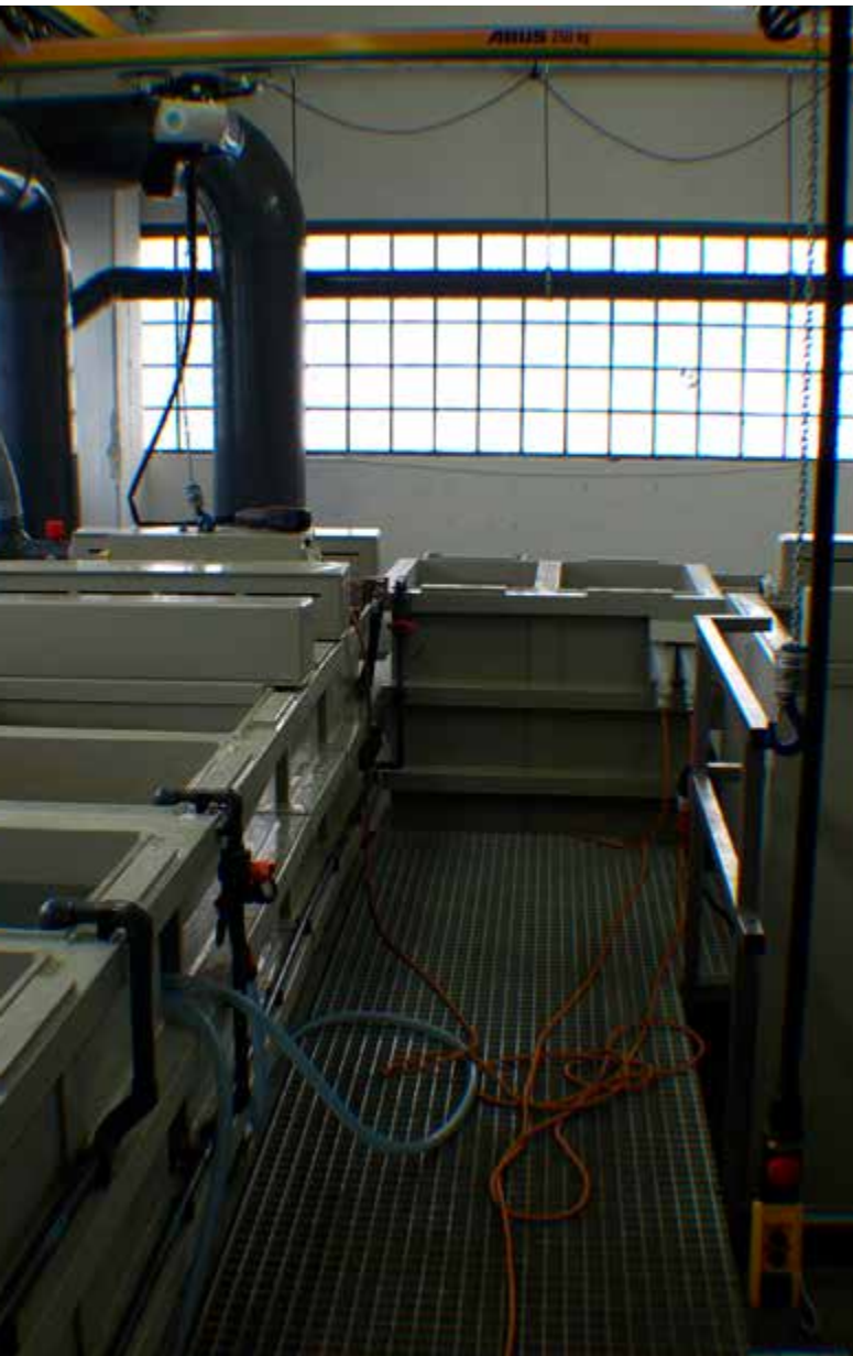
Abb. 10 Handbesockte Anlage zum chemischen Vernickeln - Stolpergefahr durch Schläuche vermeiden

Nickelhaltige Aerosole und Säuredämpfe beim chemischen Vernickeln von Einzelbauteilen verursachen inhalative und dermale chemische Gefährdungen, freier Wasserstoff führt zu Brand und Explosionsgefahr. Mechanische Gefährdungen sind an Beschickungseinrichtungen zu beachten. An den Behälterwänden und Rohrleitungen existieren große thermische Gefährdungen durch heiße Oberflächen.