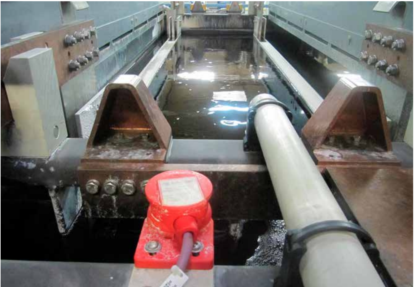
Abb. 3 Elektrolytische Entfettung mit beidseitiger Randabsaugung

Eingesetzte Laugen bei der elektrolytischen Entfettung verursachen besonders bei handbeschickten Prozessen hohe inhalative und dermale chemische Gefährdungen. Eine wirksame Absaugung reduziert diese Gefährdungen ebenso wie die Brand- und Explosionsgefahr durch den freiwerdenden Wasserstoff oder Sauerstoff. Elektromagnetische Felder gefährden nur Personen mit aktiven Implantaten.