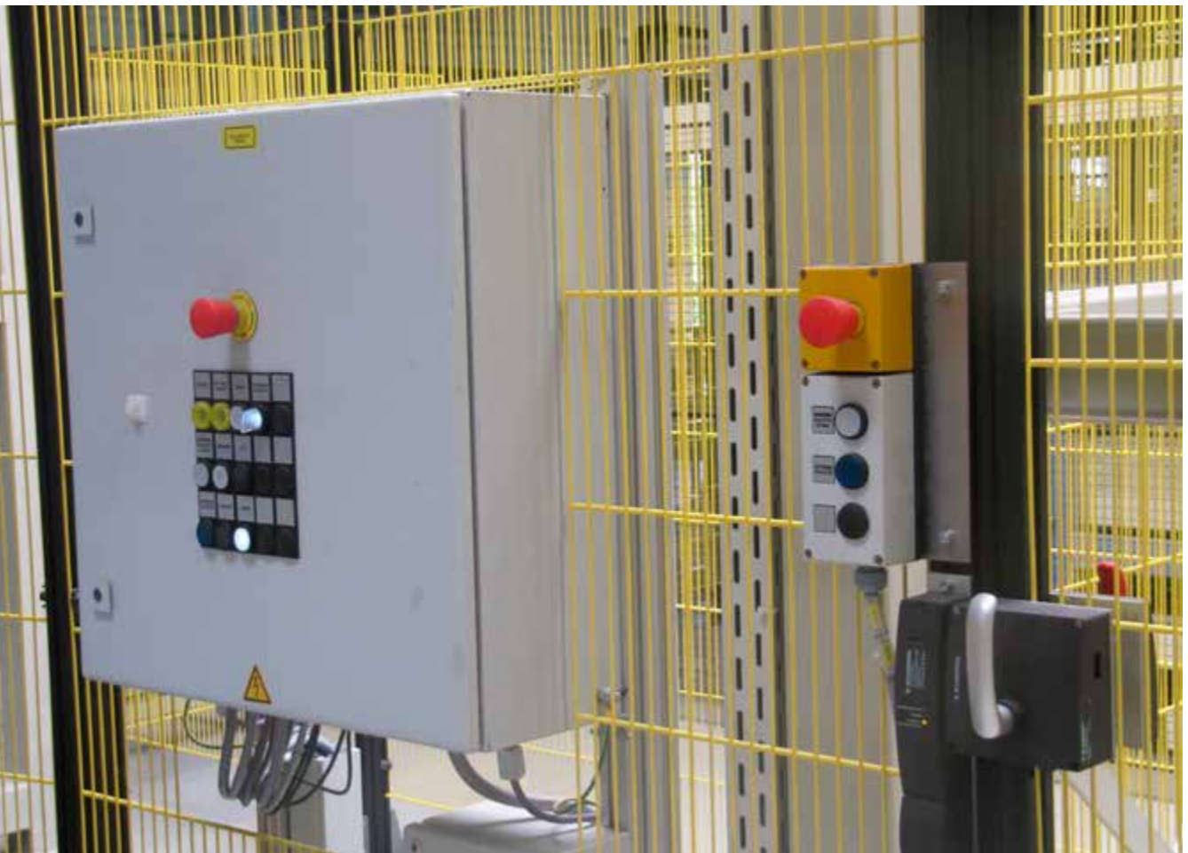
Abb. 21 Beseitigung von Störungen nur bei stillgesetzter Anlage – verriegelte Tür schützt vor ungesichertem Zugang

Störungen an Anlagen führen zu fehlbeschichteten Teilen oder zu Anlagenstillständen, z. B. durch abgestürzte Warenträger, Gestelle oder Bauteile. Dieser nicht bestimmungsgemäße Zustand kann zu Gefahren führen, die im Einzelfall betrachtet werden müssen. Überlegte Planung und Handlung zur Beseitigung der Störung ist wichtig, um Gefährdungen zu reduzieren.