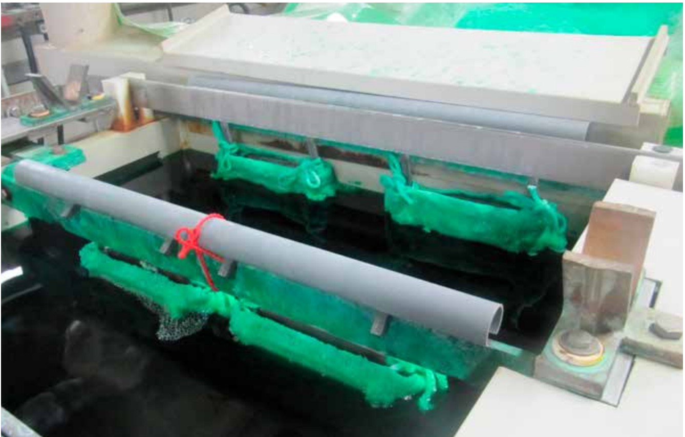
Abb. 9 Galvanisches Vernickeln mit eingehängten Anodenkörben

Nickelhaltige Aerosole und Säuredämpfe beim galvanischen Vernickeln von Einzelbauteilen verursachen inhalative und dermale chemische Gefährdungen; Elektromagnetische Felder gefährden Personen mit aktiven Implantaten. Mechanische Gefährdungen sind an Beschickungseinrichtungen und Trommelanlagen zu beachten. An Trommelanlagen existieren auch Gefährdungen durch Lärm; an den Behälterwandungen und Rohrleitungen thermische Gefährdungen durch heiße Oberflächen.