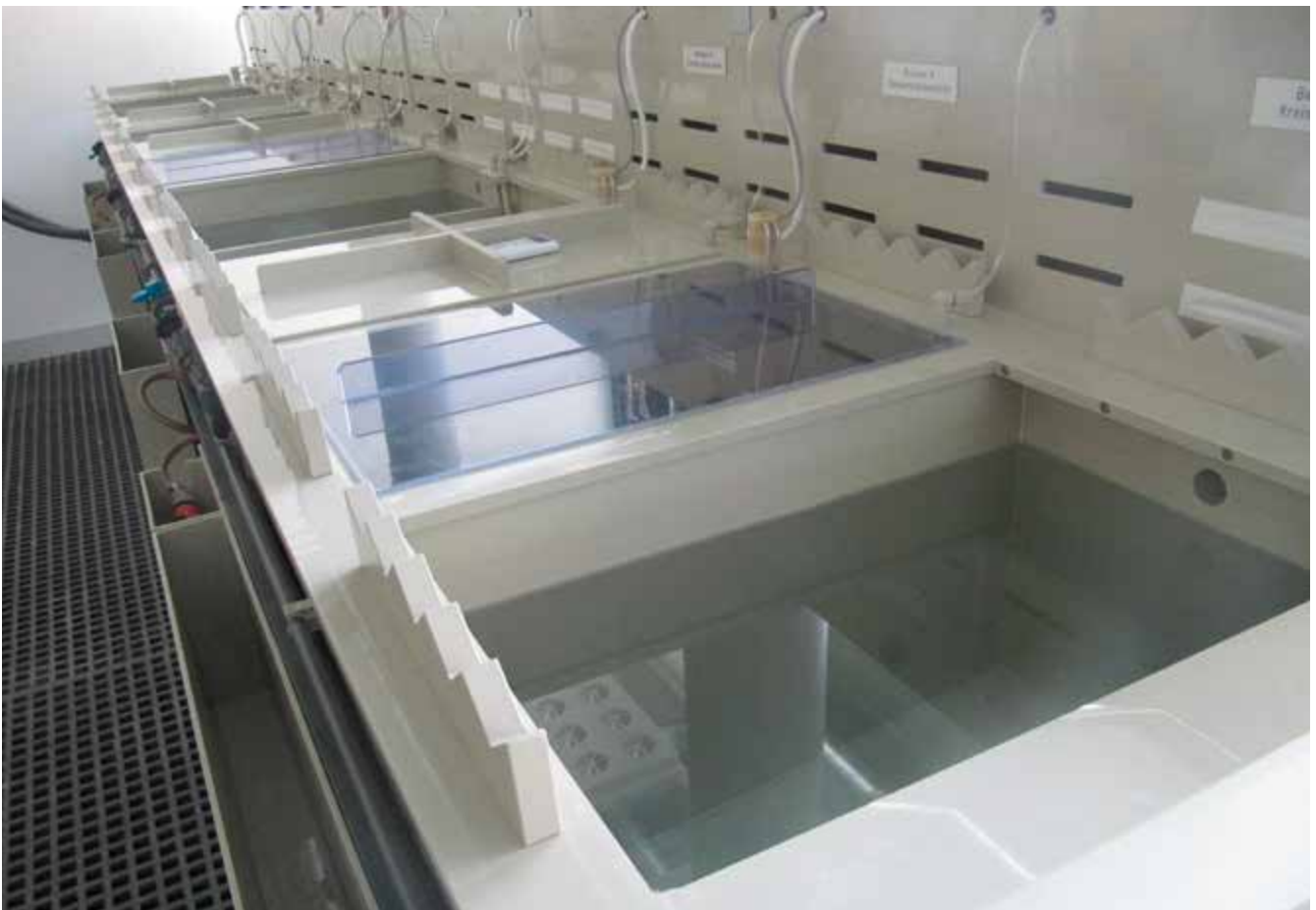
Abb. 13 Handbeschickte Anlage mit Wandabsaugung und Deckel zum Veredeln mit Gold und Silber

Bei der galvanischen Abscheidung von Gold- und Silberüberzügen aus cyanidischen Elektrolyten bestehen inhalative und dermale Gefährdungen durch die Bildung von giftigem Cyanwasserstoff. Warenträgerbewegungen an Beschickungseinrichtungen und Trommelanlagen verursachen mechanische Gefährdungen. An Bandanlagen bestehen Einzugsstellen, z. B. an Ab- und Aufwicklern. Elektromagnetische Felder in der Nähe von Wechselrichtern oder Gleichrichtern gefährden Personen mit aktiven Implantaten.