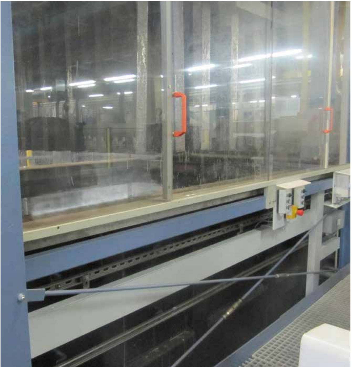
Abb. 18 Eingehauste Anlage zum Entmetallisieren

Je nach eingesetztem Gefahrstoff, Verfahren, chemischer oder galvanischer Entmetallisierung bestehen unterschiedliche inhalative und dermale Gefährdungen. Nachteilig ist die Entwicklung von gefährlichen Gasen und Dämpfen, zum Beispiel giftige Nitrose Gase beim Einsatz von Salpetersäure. Bei den überwiegend manuell bedienten Prozessen besteht eine besondere Kontaktmöglichkeit zu ätzenden Entmetallisierlösungen.