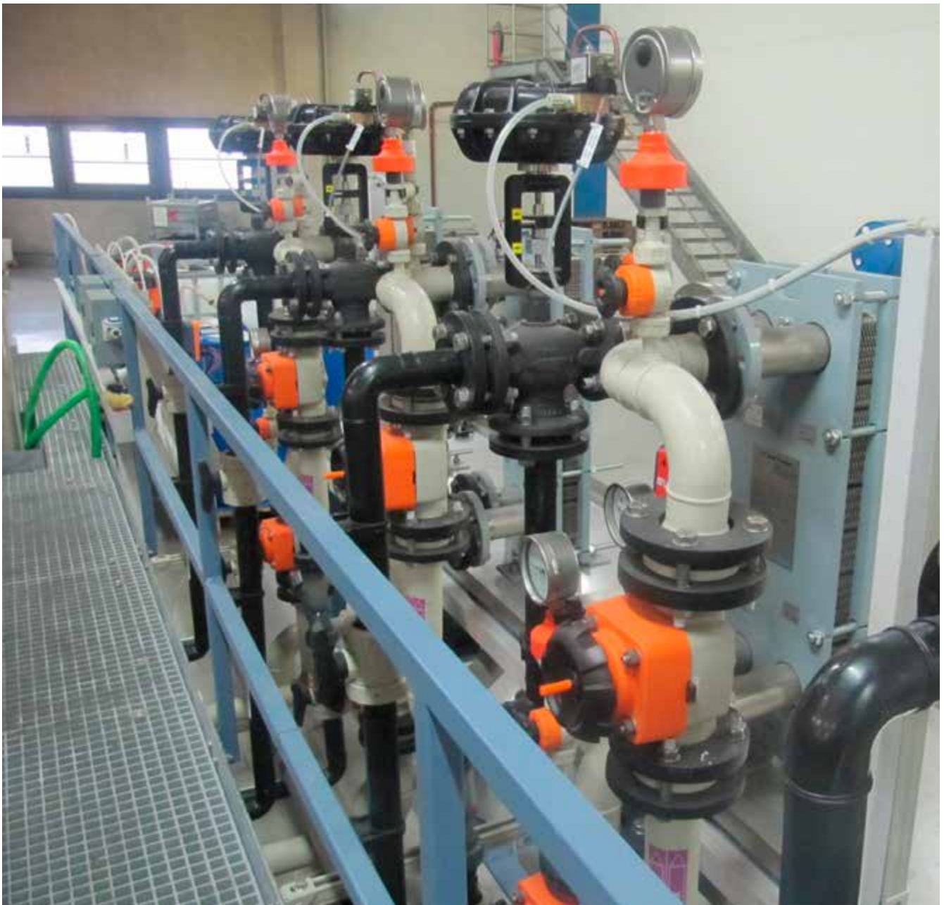
Abb. 20 Bühne zur sicheren Wartung und Instandhaltung von Nebanlagern

Um einen produktions sicheren Betrieb der Anlagen zu gewährleisten, müssen sie instandgehalten werden. Neben dem Tausch von Elektrolyten ist die Reinigung der Anlage und Komponenten eine wichtige Aufgabe; diese erfolgt im Stillstand der Anlage. Weiterhin ist für den korrekten Betrieb galvanotechnischer Anlagen oftmals eine Vielzahl von Nebenanlagen notwendig. Die Wartung dieser Nebenanlagen erfolgt dabei teilweise auch während des Betriebs der Anlagen (redundante Einrichtungen wechselseitig, z. B. Wechselschaltungen bei der Wasseraufbereitung) oder während Stillstandzeiten. Da diese Anlagen oft steuerungstechnisch mit der Anlage verbunden sind, bestehen Gefahren durch unkontrollierten Anlauf.