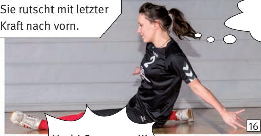
Mir geht die Puste aus. Jetzt oder nie!!!