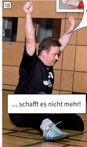
... schafft es nicht mehr!