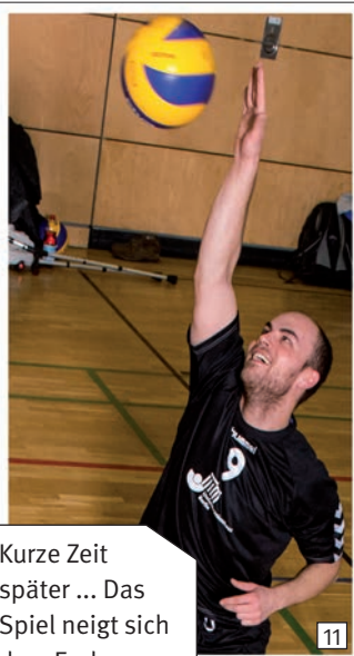
Kurze Zeit später ... Das Spiel neigt sich dem Ende zu.