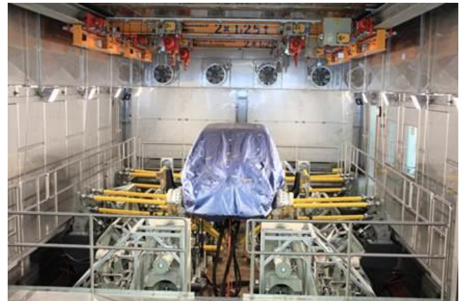
Bild 8: Servohydraulischer Fahrwerksprüfstand in separatem Prüfraum

separaten Prüfraum mit entsprechend gesicherter Zugangstür, zu erfüllen (siehe Bild 8).