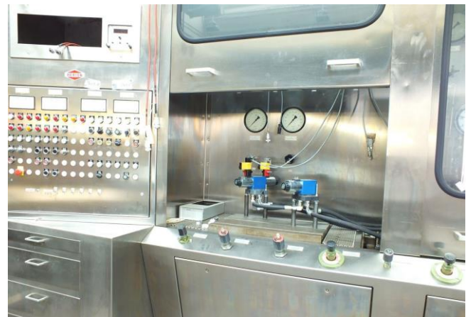
Bild 3: Hydraulischer Komponentenprüfstand mit geöffneter trennender Schutzeinrichtung

sicherung in der Produktion für Druck- und Dichtigkeitstests (siehe Bild 2) eingesetzt.