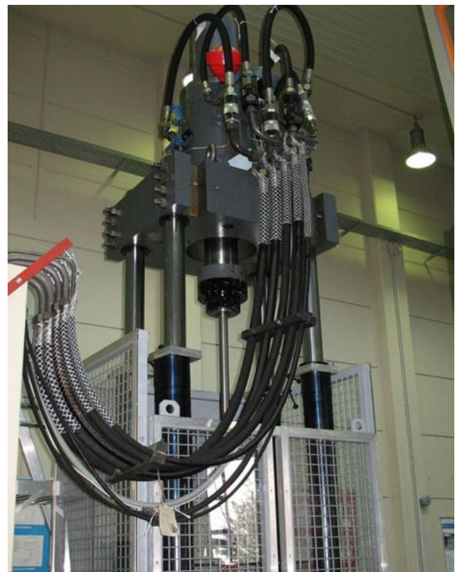
Bild 4: Hydraulischer Prüfstand für Zugversuche mit geschlossener trennender Schutzeinrichtung mit Polycarbonat-Sichtscheiben

Die Prüfstände der Festigkeitsprüfung werden u. a. zur Ermittlung des Berstdrucks (siehe Bild 1) drucktragender Hüllen oder zur Qualitäts-