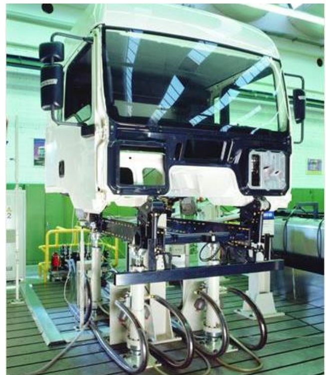
Bild 9: Servozylinder für hochdynamische Simulation von Bewegungen in separatem Prüfraum

Für den Fall, dass die zu prüfenden Bauteile mit Hilfe kraftbetätigter Spanneinrichtungen fixiert werden, ist auch für diese Spannfunktion eine Risikobeurteilung durchzuführen. Hierbei können verschiedene Maßnahmen zur Risikominderung getroffen werden, wie z. B. Tippbetrieb, begrenzter Spannhub, reduzierte Geschwindigkeit, reduzierte Kraft.