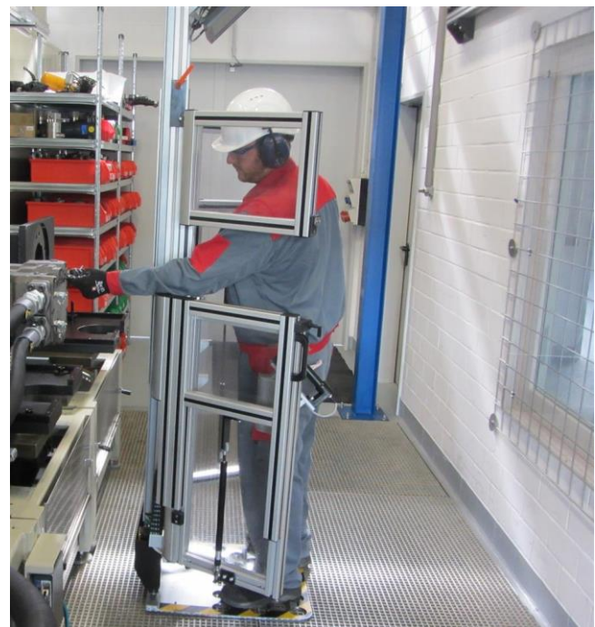
Bild 7: Manuell einstellbare Schutzeinrichtung für größtmöglichen Schutz bei Einstellarbeiten an Pumpenprüfstand in separatem Prüfraum

Die Informationsschrift FBHM-040 „Sichtscheiben an Werkzeugmaschinen der Metallbearbeitung“ [20] empfiehlt aufgrund von Versuchen mit mittigem Beschuss von Sichtscheiben an Türen von Drehmaschinen mit einer Geschossmasse von 2,5 kg verschiedene Überlappungen. Beispielsweise wird eine allseitige Überlappung mit mindestens 40 mm Überstand bei einer Scheibendicke von 8 mm oder eine allseitige Überlappung vom 25 mm Überstand bei einer Scheibendicke von 12 mm empfohlen. Ausführlichere Informationen hierzu sind der Informationsschrift FBHM-040 zu entnehmen.