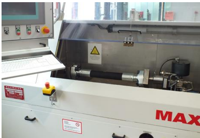
Bild 1: Berstdruckprüfstand mit geöffneter trennender Schutzeinrichtung

Hydraulische Prüfstände unterschiedlichster Bauarten, Größen und Druckniveaus werden seit Jahren eingesetzt, um beispielsweise verschiedene Hydraulikbauteile oder zusammengesetzte Baugruppen den erforderlichen Druck-, Dichtigkeits- oder Funktionstests zu unterziehen oder um Maschinen- oder Fahrzeugbauteile auf deren technische Eigenschaften oder Lebensdauer hin zu untersuchen. Sie werden sowohl in den Entwicklungsabteilungen der Bauteilhersteller zur Ermittlung und Verbesserung von Bauteileigenschaften und -kennwerten eingesetzt, als auch im Rahmen der Serienproduktion, um die gewünschte Bauteilqualität dauerhaft sicherzustellen.