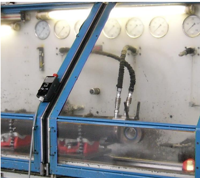
Bild 5: Hydraulischer Zylinderprüfstand mit geschlossener trennender Schutzeinrichtung

Bei den Prüfständen für statische Versuche handelt es sich zum Beispiel um Maschinen zur Erzeugung großer Zug- und Druckkräfte, mit denen mechanische Bauteileigenschaften bestimmt werden. Diese können teilweise zu den Werkstoffprüfmaschinen nach DIN 51233 [9] zählen.