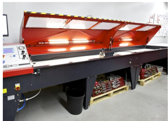
Bild 2: Druck- und Dichtigkeitsprüfstand für Hydraulik-Schlauchleitungen mit geöffneter trennender Schutzeinrichtung

Die Europäische Druckgeräte-Richtlinie fordert im Anhang I Abschnitt 3.2.2 für die Abnahme von Druckgeräten, dass dazu normalerweise hydrostatische Druckversuche durchzuführen sind und weist darauf hin, dass bestimmte Bedingungen zu erfüllen sind, bevor andere Prüfungen als die hydrostatischen Druckversuche durchgeführt werden dürfen.