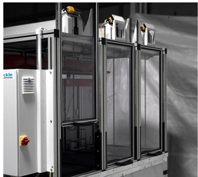
Bild 6: Geöffnete trennende Schutzeinrichtungen an einem Hydraulik-Prüfstand

Die Anforderungen an Gestaltung und Bau von feststehenden und beweglichen trennenden Schutzeinrichtungen sind in der DIN EN ISO 14120 [17] definiert.