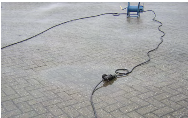
Bild 1: Druckwasserdichte Steckvorrichtung, leicht eingetaucht während eines Ausbildungsdienstes

Das Bild zeigt, dass auch auf scheinbar ebenen und befestigten Flächen mit einem Eintauchen der Steckvorrichtungen bei Nässe gerechnet werden muss.