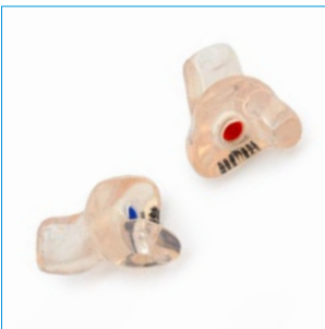
Abb. 5 Gehörschutz-Otoplastik

Ein sicherer Schutz wird nur erreicht, wenn die Gehörschutz-Otoplastik nach der Auslieferung und danach in regelmäßigen Abständen von maximal drei Jahren überprüft wird. Lassen Sie sich das richtige Einsetzen z.B. vom Hersteller oder Lieferanten der Gehörschutz-Otoplastik oder Ihrer Betriebsärztin bzw. Ihrem Betriebsarzt zeigen.