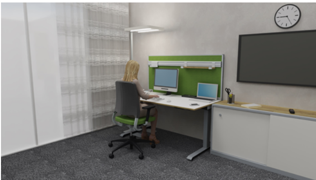
Abbildung 2 – Sitzarbeitsplatz