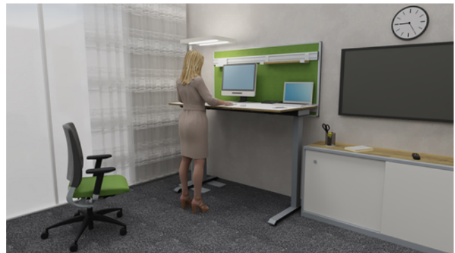
Abbildung 3 – Steharbeitsplatz