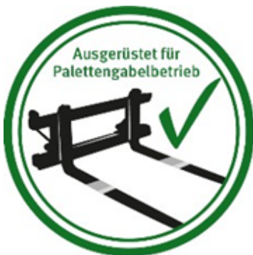
Abbildung 1 – Vorschlag für Aufkleber