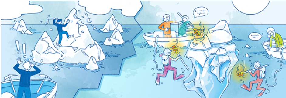
Abb. 5

Neben der Projektarbeit stand 2023 die Netzwerkarbeit mit der Weiterführung der DGUV-Erfahrungsaustausche zur Kultur der Prävention u. a. in Kooperation mit dem PASiG e. V., der aktiven Beteiligung an den „Digital Dialogen Gesundheit im Betrieb“ und am DGUV Fachgespräch Burnout im Vordergrund. Veröffentlichungen gab es z. B. in „Arbeit und Gesundheit“ (5/2023) zum Thema Fehlerkultur (siehe Grafik).