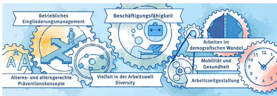
Abb. 2

Im Jahr 2023 veröffentlichte das Sachgebiet „Beschäftigungsfähigkeit“ Kulturdialoge Prävention zum Themenbereich Arbeitszeit ( www.publikationen.dguv.de › Webcode: p022356 ). Zudem wurde im Berichtsjahr die Publikation „FBGIB-003: Demografische Begriffe mit Bezug zur Arbeitswelt“ überarbeitet ( www.publikationen.dguv.de › Webcode: p017683 ).