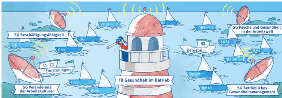
Abb. 1

Der Fachbereich „Gesundheit im Betrieb“, der vier Sachgebiete – „Beschäftigungsfähigkeit“, „Betriebliches Gesundheitsmanagement“, „Psyche und Gesundheit in der Arbeitswelt“ sowie „Veränderung der Arbeitskulturen“ – umfasst, arbeitet branchenübergreifend. Seine Aufgaben und Inhalte orientieren sich insbesondere am „Gemeinsamen Verständnis zur Ausgestaltung des Präventionsfeldes ‚Gesundheit im Betrieb‘ durch die Träger der gesetzlichen Unfallversicherung und die Deutsche Gesetzliche Unfallversicherung e.V. (DGUV)“ ( www.dguv.de › Webcode: d1182742 ). Dieses Verständnis stellt zudem den Handlungsrahmen für die gesetzliche Unfallversicherung dar.