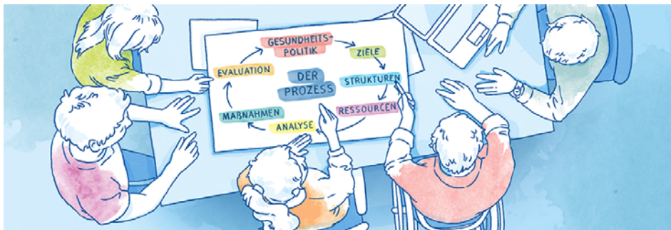
Abb. 3

Die Überarbeitung der „Qualitätskriterien im Präventionsfeld ‚Gesundheit im Betrieb‘ der gesetzlichen Unfallversicherungsträger und der DGUV“ wurde im Berichtsjahr abgeschlossen. Sie wurden als DGUV Grundsatz 306-002 „Präventionsfeld ‚Gesundheit bei der Arbeit‘ – Positionierung und Qualitätskriterien“ ( www.publikationen.dguv.de › Webcode: p306002 ) veröffentlicht. Kerninhalte dieses DGUV Grundsatzes wurden im Rahmen eines „Digital-Dialogs Gesundheit im Betrieb“ im Dezember 2023 vorgestellt. Dabei wurden den Teilnehmenden neben den begrifflichen Grundlagen und Zielsetzungen im Präventionsfeld „Gesundheit bei der Arbeit“ insbesondere das Qualitätskriterienmodell und dessen Einsatzmöglichkeiten vermittelt.