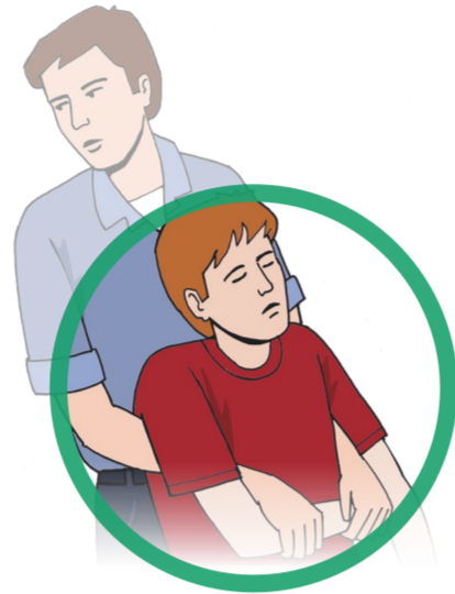
Person ggf. aus dem Gefahrenbereich retten