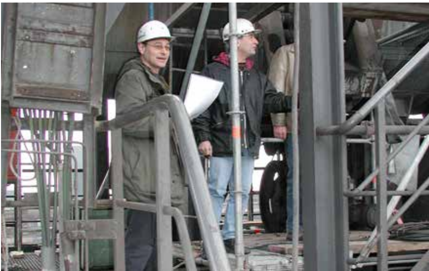
Bild 2-2: Einweisung des Verantwortlichen der Fremdfirma durch den Auftragsverantwortlichen

Die Einweisung sollte in einem Protokoll dokumentiert werden (Beispiel Anhang 3). Im Einweisungsprotokoll wird ausdrücklich auf die Pflicht des Verantwortlichen der Fremdfirma hingewiesen, dass dieser die zum Einsatz kommenden Mitarbeiter der Fremdfirma nachfolgend zu unterweisen hat.