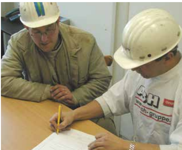
Bild 2-8: Gemeinsames Festlegen der zu treffenden Sicherheitsmaßnahmen

Der Verantwortliche der Fremdfirma muss sich deshalb vor Beginn der Arbeiten mit dem Auftragsverantwortlichen in Verbindung setzen und eine Gefährdungsbeurteilung am zukünftigen Arbeitsplatz durchführen. Die abgestimmten Sicherheitsmaßnahmen werden schriftlich fixiert (Beispiel Anhang 4) und liegen bei der Auftragsausführung vor.