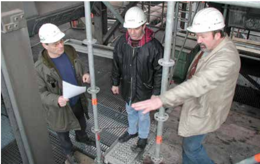
Bild 2-4: Gemeinsame Ermittlung von Gefährdungen (Auftragsverantwortlicher, Verantwortlicher der Fremdfirma, zuständiger Meister)

Abgestimmte Sicherheitsmaßnahmen sollten schriftlich fixiert werden und bei der Auftragsausführung vor Ort vorliegen.