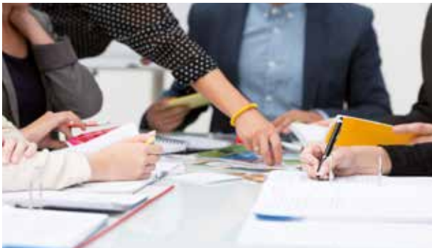
Bild 2-7: Unterweisen der Mitarbeiter durch den Verantwortlichen der Fremdfirma

Werden von der Fremdfirma nicht ausreichend der deutschen Sprache mächtige Mitarbeiter eingesetzt, muss die Fremdfirma gewährleisten, dass diese Mitarbeiter die Arbeitsschutzbestimmungen eindeutig verstehen.