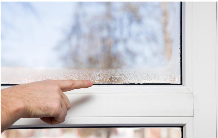
Abbildung 3 – Bildung von Kondenswasser an einer kalten Oberfläche

Durch „falsches“ Lüftungsverhalten, wie z. B. zu langes Stoßlüften im Winter oder Dauerkippstellung von Fenstern, oder auch durch eine zu starke Absenkung der Lufttemperatur bzw. durch ein Nichtbeheizen von Räumlichkeiten können Gebäudeteile auskühlen. Die ausgekühlten Wände, Fußböden und Decken lassen ein unbehagliches Raumklima entstehen und beeinträchtigen die Raumlufthygiene, da bei vorhandenen Feuchtelasten die Entstehung von Kondenswasser (siehe Abbildung 3) und der Befall von Schimmelpilzen begünstigt werden können.